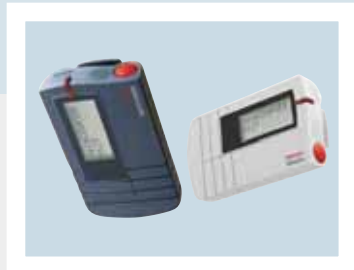
Récepteur Ascocom 912T.