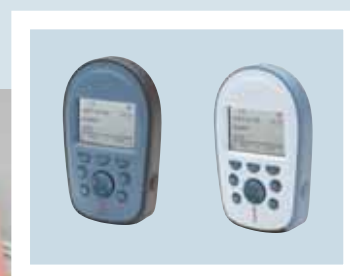
Emetteur* / récepteur Ascom p71. *en option

Les messages peuvent être directement envoyés depuis tout PC connecté au réseau local vers tout récepteur du système. Le bon message est envoyé à la bonne personne, au bon moment, où qu'elle se trouve.