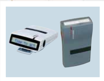
Récepteur Ascocom 914DC.